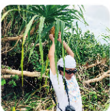
川担当 (和歌山県立自然博物館)

日本学術振興会特別研究員PD(愛媛大学大学院理工学研究科)。和歌山県海南市出身。北海道大学水産学部・同大学院水産科学院卒。博士(水産科学)。学部時より、北海道のイワナや古座川源流部のアマゴの稚魚を対象に、河川生物が水流に流され移動することで小進化が生じる可能性を研究してきた。最近は棚田の用水路での研究や魚類のあくび行動の研究にも着手している。好物は焼イモ。