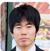
山担当 (学振特別PD(愛媛大学))

学振特別PD(山担当)、和歌山県立自然博物館(川担当)、近畿大学(海担当)によるリレー形式の講演。